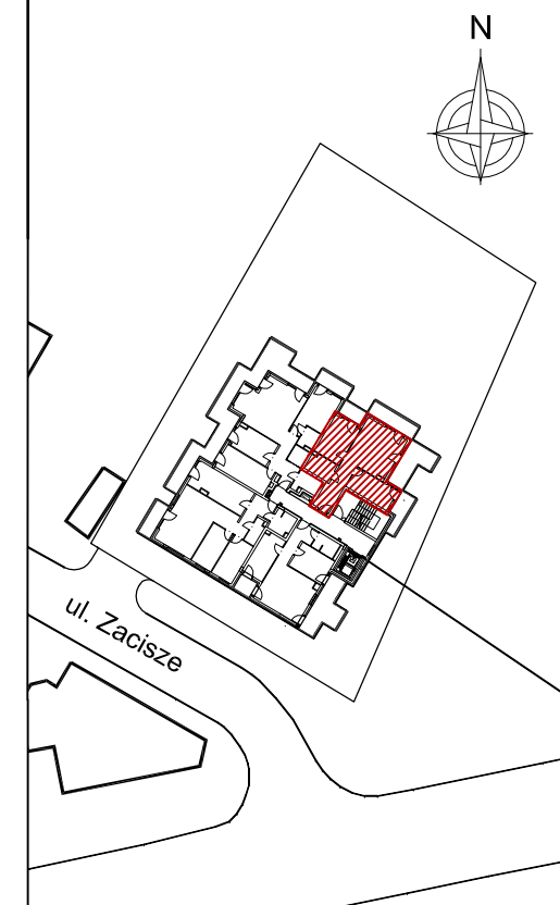
Mieszkanie nr 24