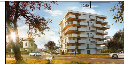
parter lokalizacja mieszkania