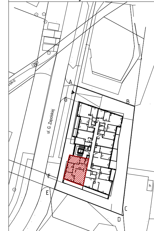
Mieszkanie nr 32