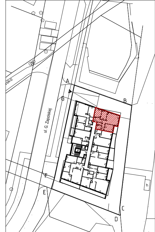
Mieszkanie nr 28