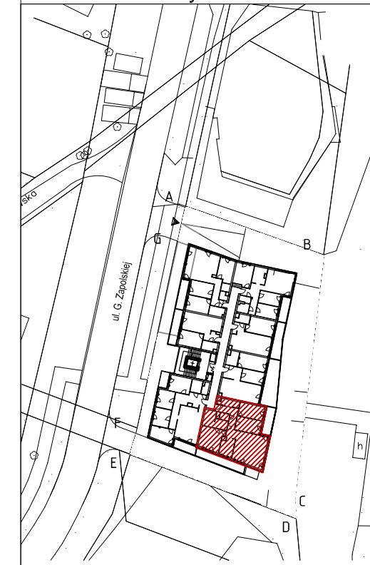
Mieszkanie nr 17