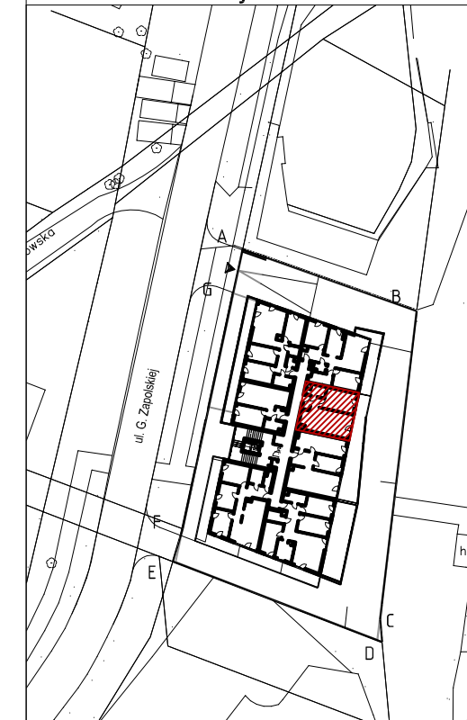
Mieszkanie nr 8